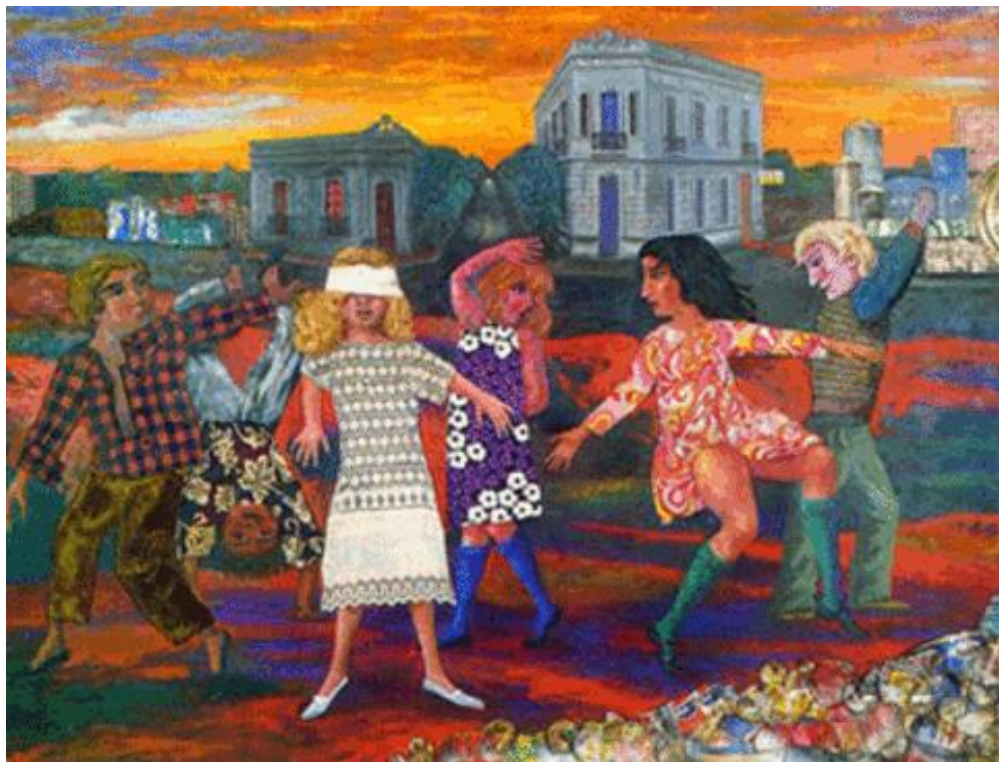
Antonio Berni. “La gallina ciega”, 1972